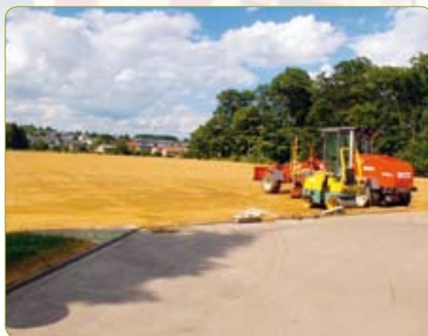
Synthetisches Sportfeld: Für den Schulsport können feste Wochenstunden reserviert werden.