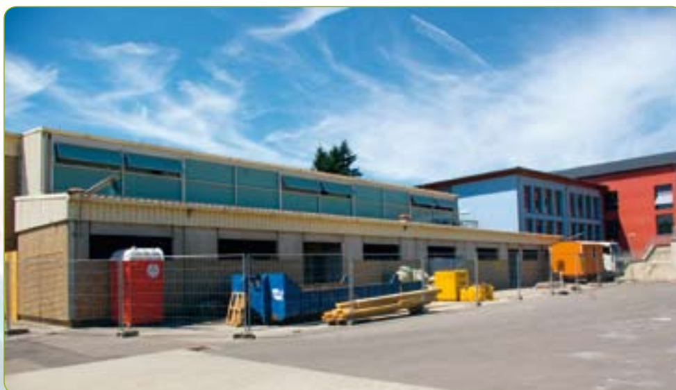
Hall sportif: nouveau sanitaire et amélioration du hall sportif.

Bessere Einrichtungen für den Schulsport: für das kommende Schuljahr stehen den Schulklassen zwei verbesserte Sportstätten zur Verfügung: die renovierte Sporthalle und ein synthetisches Sportfeld.