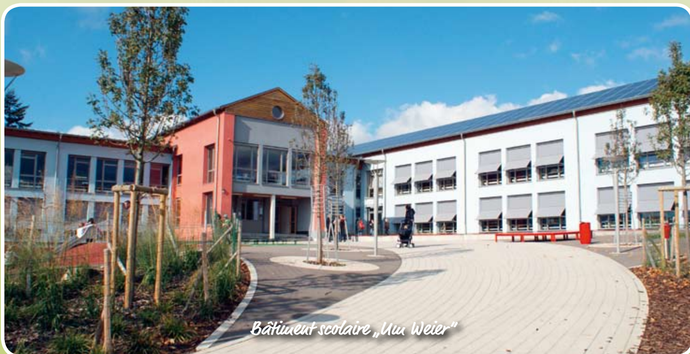
Bâtiment scolaire „Uux Weier“