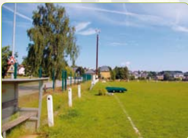
Terrain synthétique: des plages fixes peuvent être réservées pour l'éducation sportive.