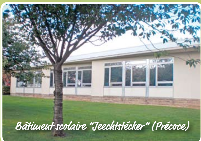
Bâtiment scolaire "Jeechtstécker" (Précoce)